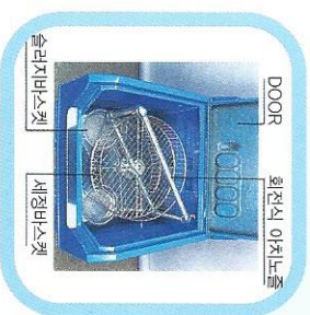
DOOR 회전식 아치노즐 슬러지바스켓 세정바스켓